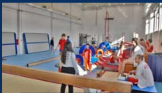
СОКОЛСКИ ДОМ - ФУТОГ