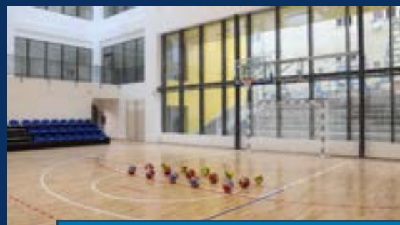
ОШ „МИЛОШ ЦРЊАНСКИ“