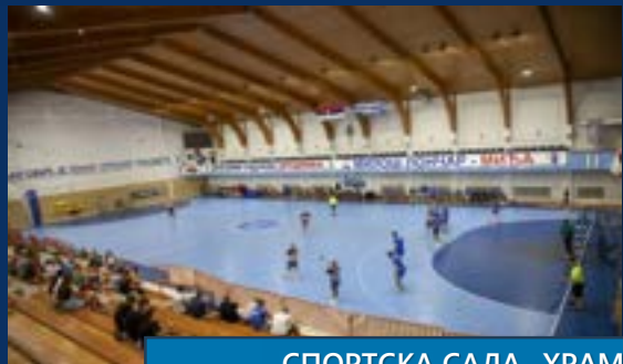
СПОРТСКА САЛА „ХРАМ“