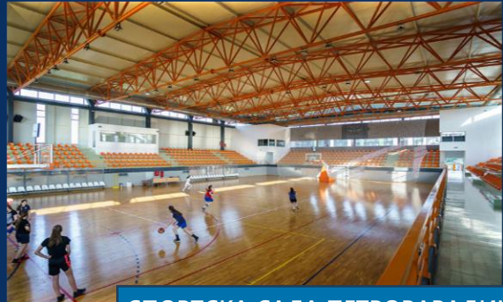
СПОРТСКА САЛА ПЕТРОВАРАДИН