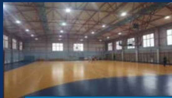
ГИМНАЗИЈА „ИСИДОРА СЕКУЛИЋ“