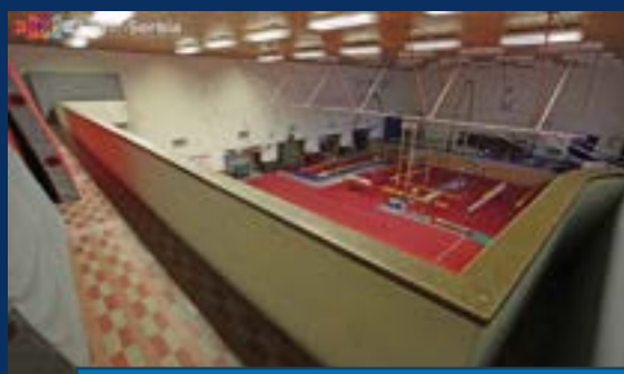
СОКОЛСКИ ДОМ – НОВИ САД