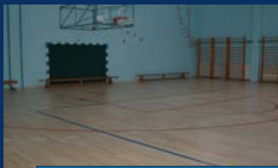
ОШ „ЈОВАН ПОПОВИЋ“