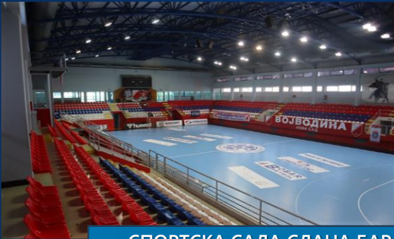
СПОРТСКА САЛА СЛАНА БАРА