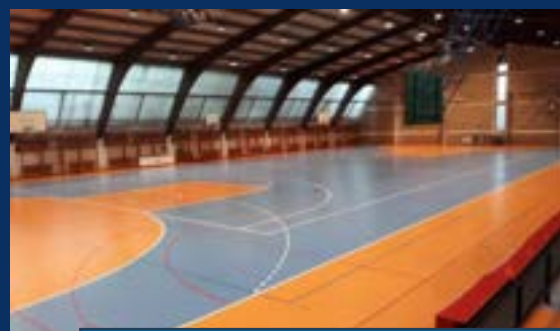
ОШ „ПРВА ВОЈВОЂАНСКА БРИГАДА“