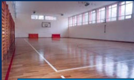
ОШ „ЂОРЂЕ НАТОШЕВИЋ“