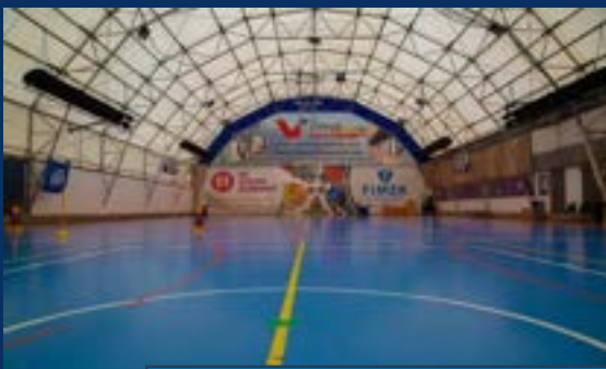
СПОРТСКА САЛА МАР УК

У непосредној близини се налази: стадион Слана бара, затворени базен Слана бара