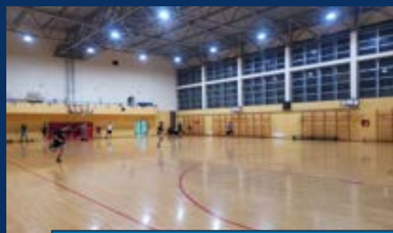
ОШ „ВУК КАРАЏИЋ“