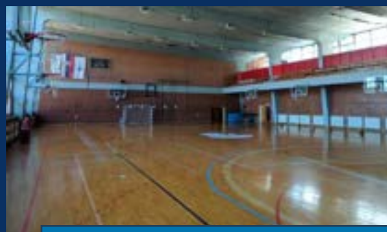
ФАКУЛТЕТ ЗА СПОРТ И ФИЗИЧКО ВАСПИТАЊЕ