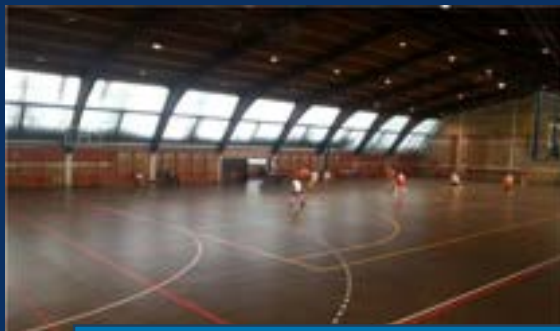
ОШ „ЈОЖЕФ АТИЛА“