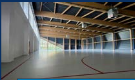
ГИМНАЗИЈА „ЛАЗА КОСТИЋ“