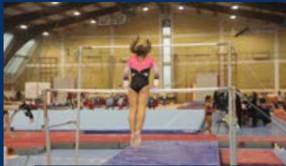
ОШ „ПРВА ВОЈВОЂАНСКА БРИГАДА“