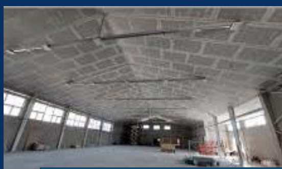
ОШ „ДЕСАНКА МАКСИМОВИЋ“ ФУТОГ