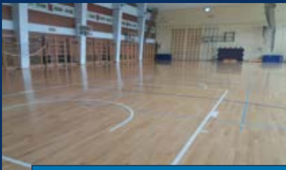
ФАКУЛТЕТ ЗА СПОРТ И ФИЗИЧКО ВАСПИТАЊЕ